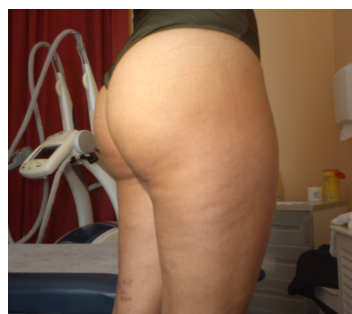
APÓS 1ª Sessão