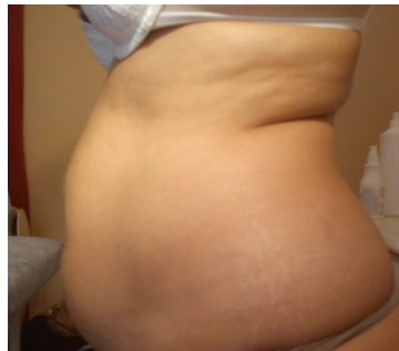
APÓS 1 Sessão